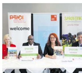
Bildungsdelegation in Tirol