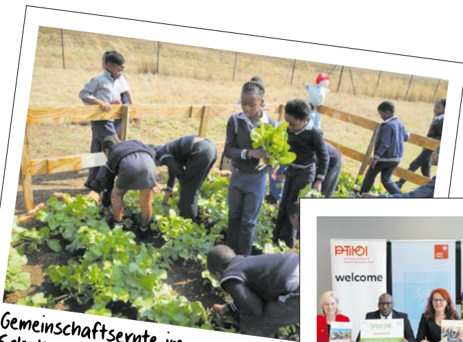
Gemeinschaftsernte im Schulgarten